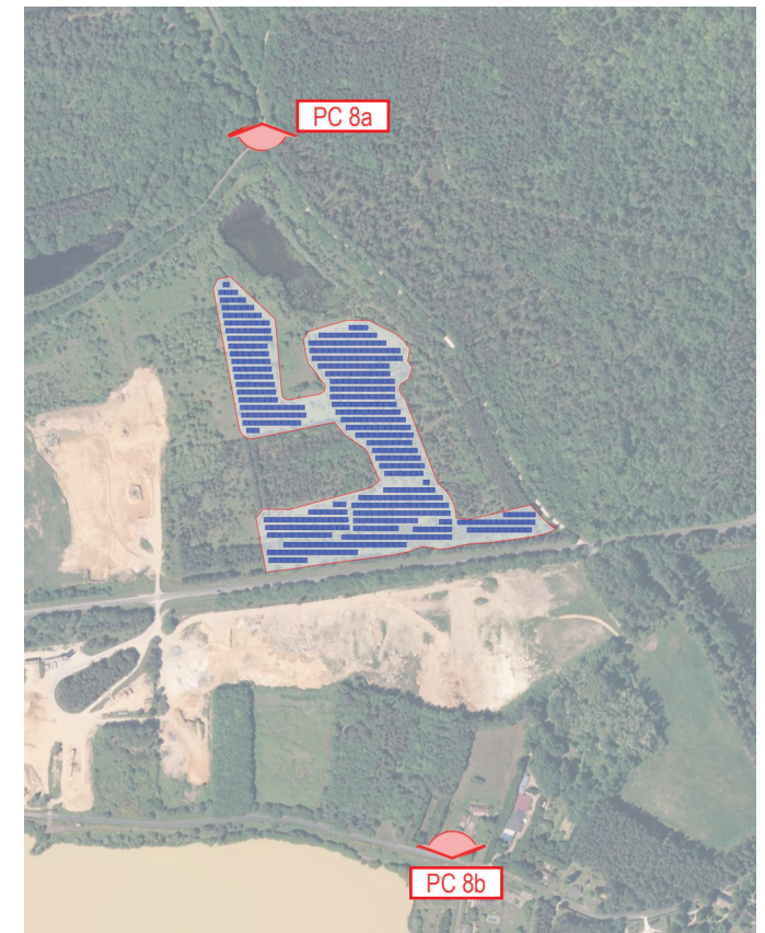
PLAN DE REPÉRAGE DES VUES